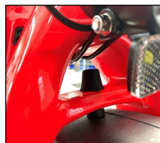
Nouveau système de fixation

Cycling Sports Group Europe B.V. Hanzepoort 27 Oldenzaal, 7575DB Tél. 0541 20 05 87 option 1