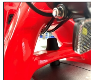
Sistema di fissaggio aggiornato

Cycling Sports Group Europe B.V. Hanzepoort 27, Oldenzaal, 7575DB tel.: 0541 20 05 87 opzione 1